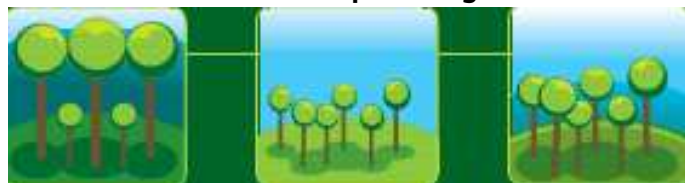
Une forêt d'arbres vieillissants