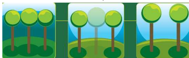
Illustration d'une coupe d'amélioration

La forêt continuera de grandir dans les meilleures conditions.