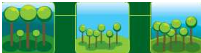
Une forêt d'arbres vieillissants