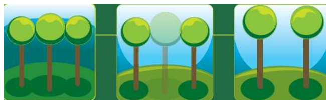
Illustration d'une coupe d'amélioration