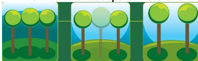
Une forêt dense et sombre