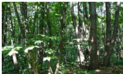
Avant la coupe de taillis