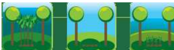
Illustration d'une coupe de taillis

Une forêt composée d'arbres de futaie et de taillis