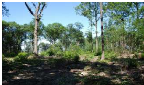
Après la coupe de taillis