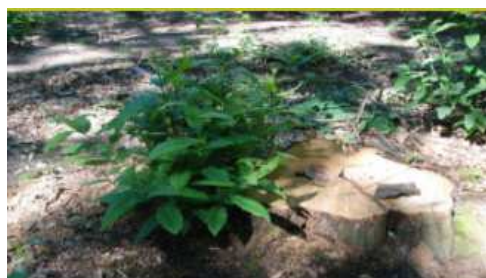
L'arbre rejette de souche

> Une coupe de taillis sera réalisée sur 6,17 hectares de la parcelle 95. Elle a pour objectif de rajeunir le peuplement.