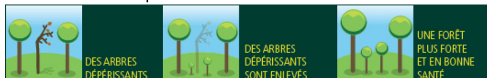
Illustration d'une coupe sanitaire

Cette intervention consiste à enlever tous les arbres dépérissants et dangereux afin de sécuriser le parc ainsi que les arbres en bord de route. 200 arbres seront enlevés.