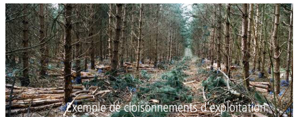
Exemple de cloisonnements d'exploitation

Appelés cloisonnements d'exploitation , ces chemins d'accès régulièrement espacés facilitent la circulation des engins forestiers sur la parcelle et protègent les sols.