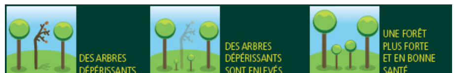
Illustration d'une coupe sanitaire

Suite à cette coupe, le paysage forestier sera modifié : il deviendra plus éclairé.