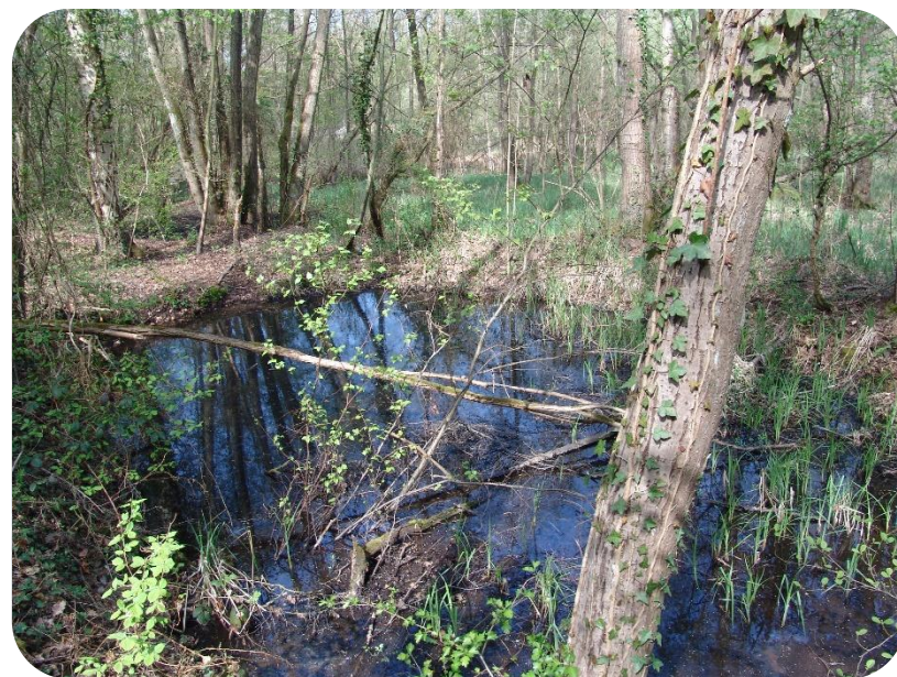
Forêt départementale de PINCELOUP- Sonchamp

Sur les forêts départementales de Pinceloup et de St Benoît ( Clairefontaine St Arnoult-en-Yvelines et Sonchamp ), les principales sources de biodiversité menacées sont localisées dans les mares. La forêt de Pinceloup en compte 10, St Benoît 20 . Une partie de ces mares était sur le point de disparaître, dégradées par l'atterrissement naturel, le manque de lumière ou la sur fréquentation des sangliers. Le Département en a restauré une dizaine .