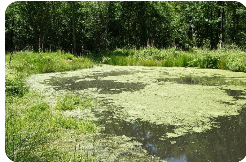
Forêt départementale de RONQUEUX - Bullion

La création ou la restauration de mare permet de conserver des continuités écologiques (trame bleue) et de favoriser la biodiversité (amphibiens, plantes aquatiques, habitats...).