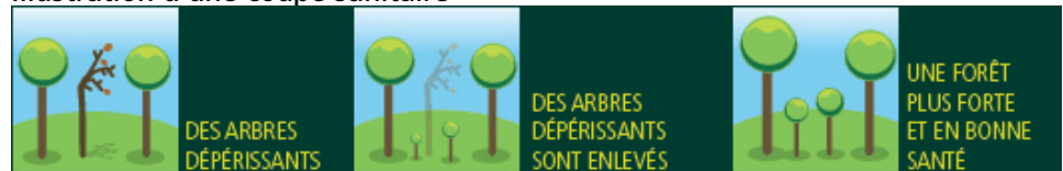
Illustration d'une coupe sanitaire