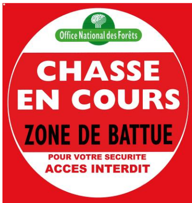
Exemple de panneau positionné en forêt