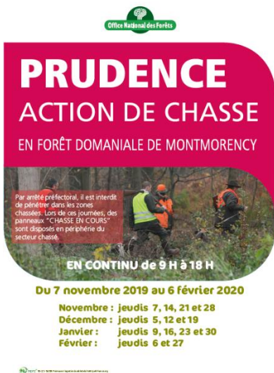
Le calendrier des jours chassés est positionné sur les panneaux en forêt. Exemple de Montmorency

L’ONF suit le même protocole pour évaluer la population de grand gibier. Cette constance sur plusieurs décennies permet d’avoir une vision de la dynamique des populations et d’adapter les plans de chasse en conséquence. Les sangliers, quant à eux, de plus en plus nombreux, sont une espèce classé nuisible par arrêté préfectoral. Il font l’objet d’une pression plus forte de régulation.