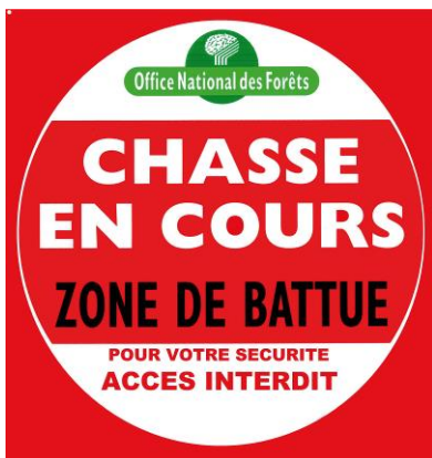
Exemple de panneau positionné en forêt