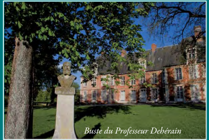
Buste du Professeur Dehérain