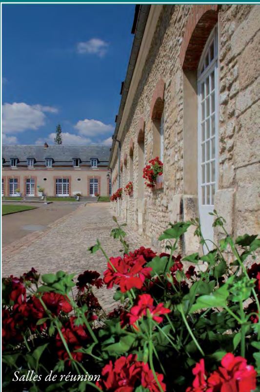
Salles de réunion