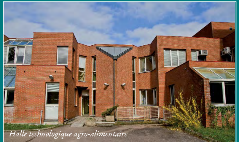
Halle technologique agro-alimentaire