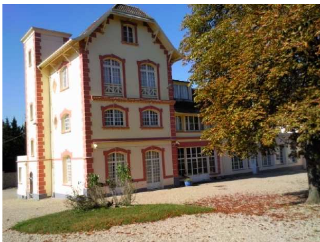
Photo prise en octobre 2011 de la façade Est de la maison de Chintreuil.

Par conséquent, pas d'ambiguïté sur ce point, elle est parfaitement identifiable avec sa tourelle et son clocheton et il ne s'agit pas du logement d'un quelconque gardien.