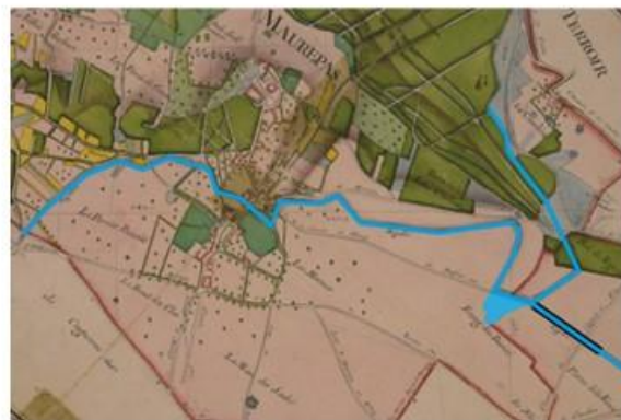
Cheminement des rigoles mis en évidence sur le plan d'intendance de la paroisse de Maurepas Archives départementales des Yvelines (1787) (extrait de l'exposition 2009 de Maurepas d'hier et d'aujourd'hui )