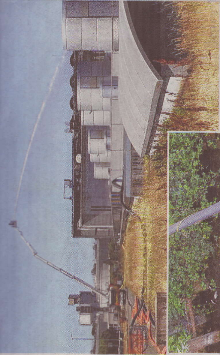
Saint-Germain-en-Laye, hier. Deux jours après l'incendie, des foyers subsistent au sein de l'usine du SIAAP. Il y a aussi de nombreux poissons morts.