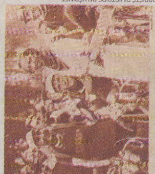
SOCIÉTÉ D'HISTOIRE DU VÉSINET

Quand la commune donnait le départ du Tour P. II