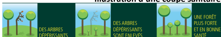
Illustration d'une coupe sanitaire

Ces arbres dépérissants représentent un danger sérieux pour les promeneurs et usagers des forêts. Les risques de chablis (déracinement) et de chutes de branches seront évités grâce à ces coupes sanitaires diminuant ainsi les dangers pour les promeneurs.