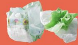
Couches, Papiers absorbants