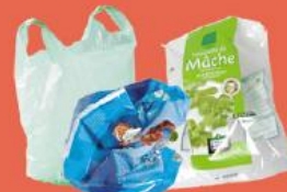
Sacs en plastique