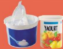
Pots de yaourt

Les déchets du quotidien, à jeter dans la poubelle ordinaire.