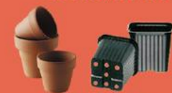
Pots de fleurs