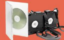
Cassettes, CD, DVD