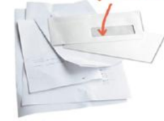
Enveloppes, Papiers, Courriers