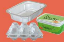
Boîtes en plastique