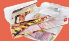
Barquettes en plastique