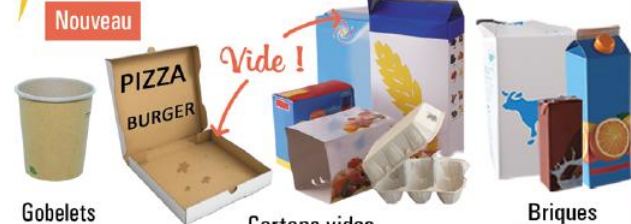
Gobelets en carton