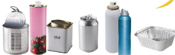
Boîtes de conserve