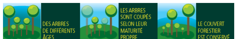
Illustration d'une coupe en futaie irrégulière

L'ONF a annoncé le changement de gestion pour les forêts périurbaines, avec le passage à une sylviculture dite en futaie irrégulière . Ce mode de sylviculture répond à la demande sociale de préserver le paysage forestier lors des coupes.