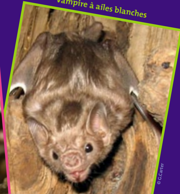
Vampire à ailes blanches