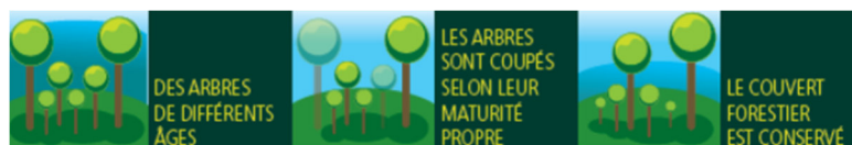
Illustration d'une coupe en futaie irrégulière

>> Les travaux sylvicoles avaient démarré sur la parcelle 26 en janvier 2020 . Le chantier n'étant pas finalisé, il reprendra en parallèle des coupes sur les parcelles 25, 35 et 36.