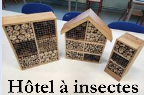
Hôtel à insectes

Il attire les insectes utiles au jardin et participe à la conservation de la biodiversité