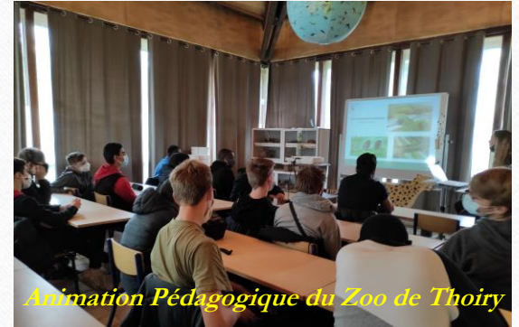
Animation Pédagogique du Zoo de Thoiry