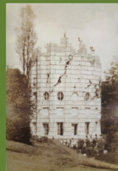
1ère photo de la Colonne vers 1850

Le Désert de Retz a survécu au mépris de propriétaires indécents, aux outrages du temps et de la nature. Il dispose d'atouts remarquables dignes du combat mené, souhaitons qu'il trouve les moyens nécessaires pour lui redonner son lustre d'antan.