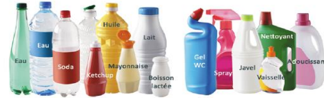
Bouteilles et flacons