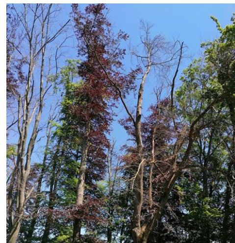
>> Photo d'arbres dépérissants parcelle 53a forêt de Fausse Reposes

>> Ces coupes seront réalisées par un exploitant extérieur à l'ONF