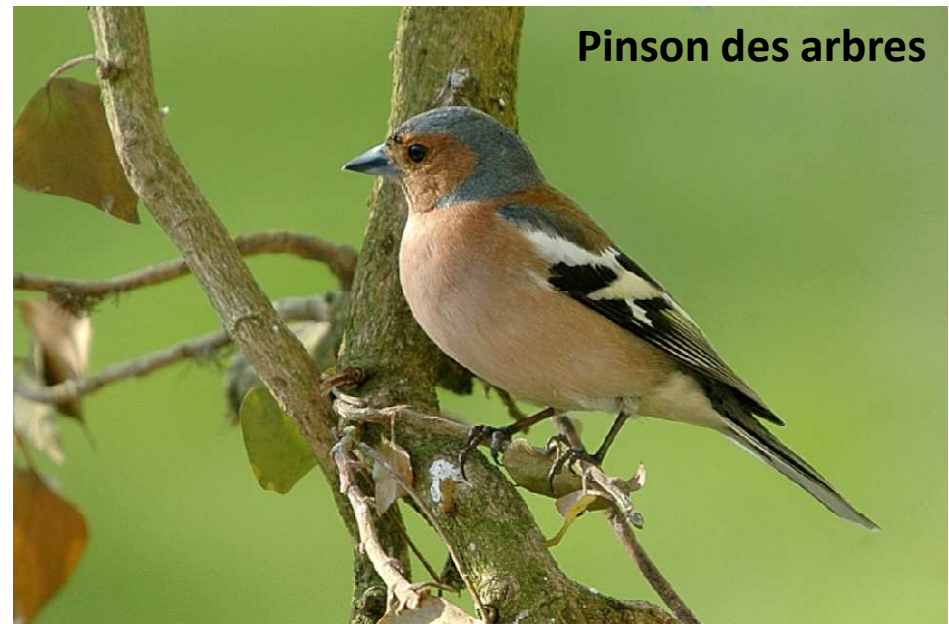
Pinson des arbres